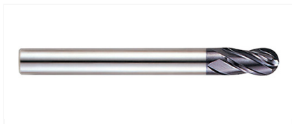
GM815020 Фреза 4-х зубая сферическая 2X6X5X50 X-POWER PRO