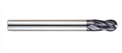
GM815030 Фреза 4-х зубая сферическая 3X6X8X60 X-POWER PRO