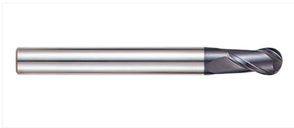
GM813050 Фреза 2-х зубая сферическая 5X6X10X80 X-POWER PRO