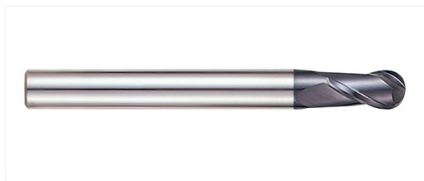
GM813020 Фреза 2-х зубая сферическая 2X6X5X50 X-POWER PRO