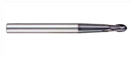
GM902906 Фреза 2-х зубая сферическая 4X6X8(10)X90 X-POWER PRO