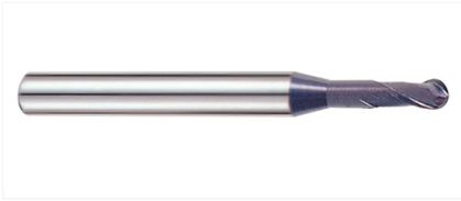
GM886967 Фреза 2-х зубая сферическая 2X4X3(30)X70 X-POWER PRO