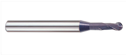
GM886940 Фреза 2-х зубая сферическая 2X4X3(6)X45 X-POWER PRO