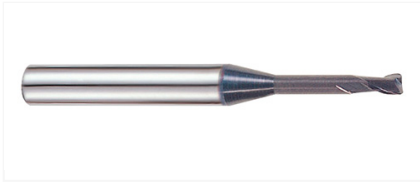
GM886921 Фреза 2-х зубая сферическая 1X4X1.5(4)X45 X-POWER PRO