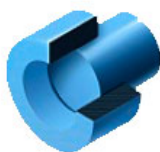
Сопряжения с посадками с натягом