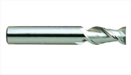
E5522040 Фреза 2-х зубая концевая 4X6X11X57 ALU-POWER