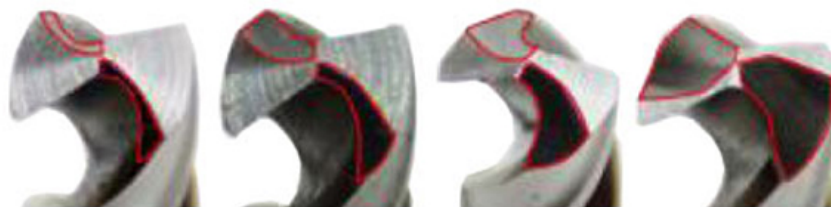
4 профиля заточки задней поверхности сверла