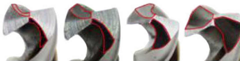
4 профиля заточки задней поверхности сверла