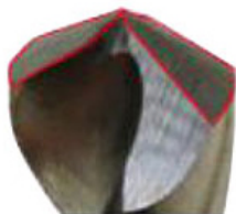
Угол при вершине

Легкая компактная конструкция, удобная для транспортировки, есть ручка. Устанавливается в любом удобном месте, где есть возможность подключить станок к сети 220 В.