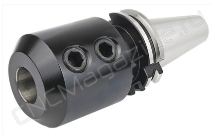
SK40-SL32-105 Патрон Weldon DIN69871 (DIN69871.40-SLN32-105)